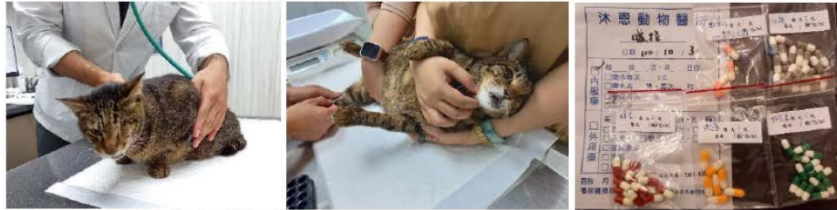
治療肝炎黃疸及背上腫塊追蹤